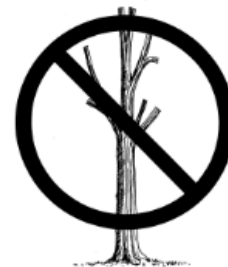
Figure 13. Never top a tree, the regrowth is structurally unsound, making it very prone to wind and storm damage.

Shade trees should never be topped. The regrowth of a topped tree is structurally unsound. Topping required by utility right-of-way pruning is starkly obvious and sets an unfortunate community standard followed by others. Instead of topping, use cleaning , thinning , and/or proper crown reduction cuts . [Figure 13]